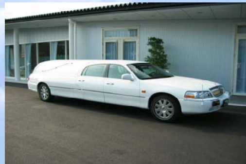
【リンカーン霊柩車 (遺族4名乗車)】