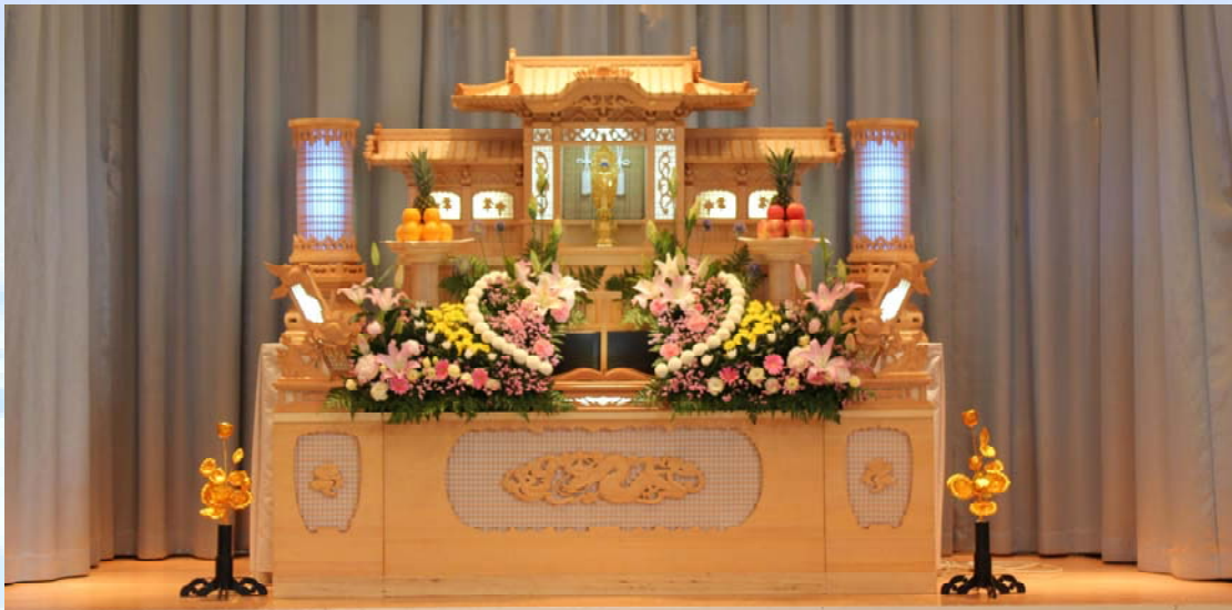
【大ホール祭壇 20号祭壇 (生花込み)】