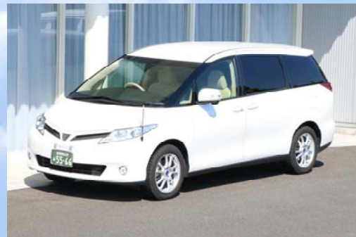
【エスティマ霊柩車 (遺族1名乗車)】