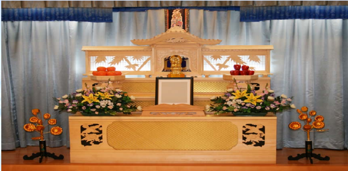
【小ホール祭壇 10号祭壇】