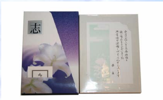
【(通夜品) (15個) 1個当り200円】 【(会葬品) (30個) 1個当り600円】